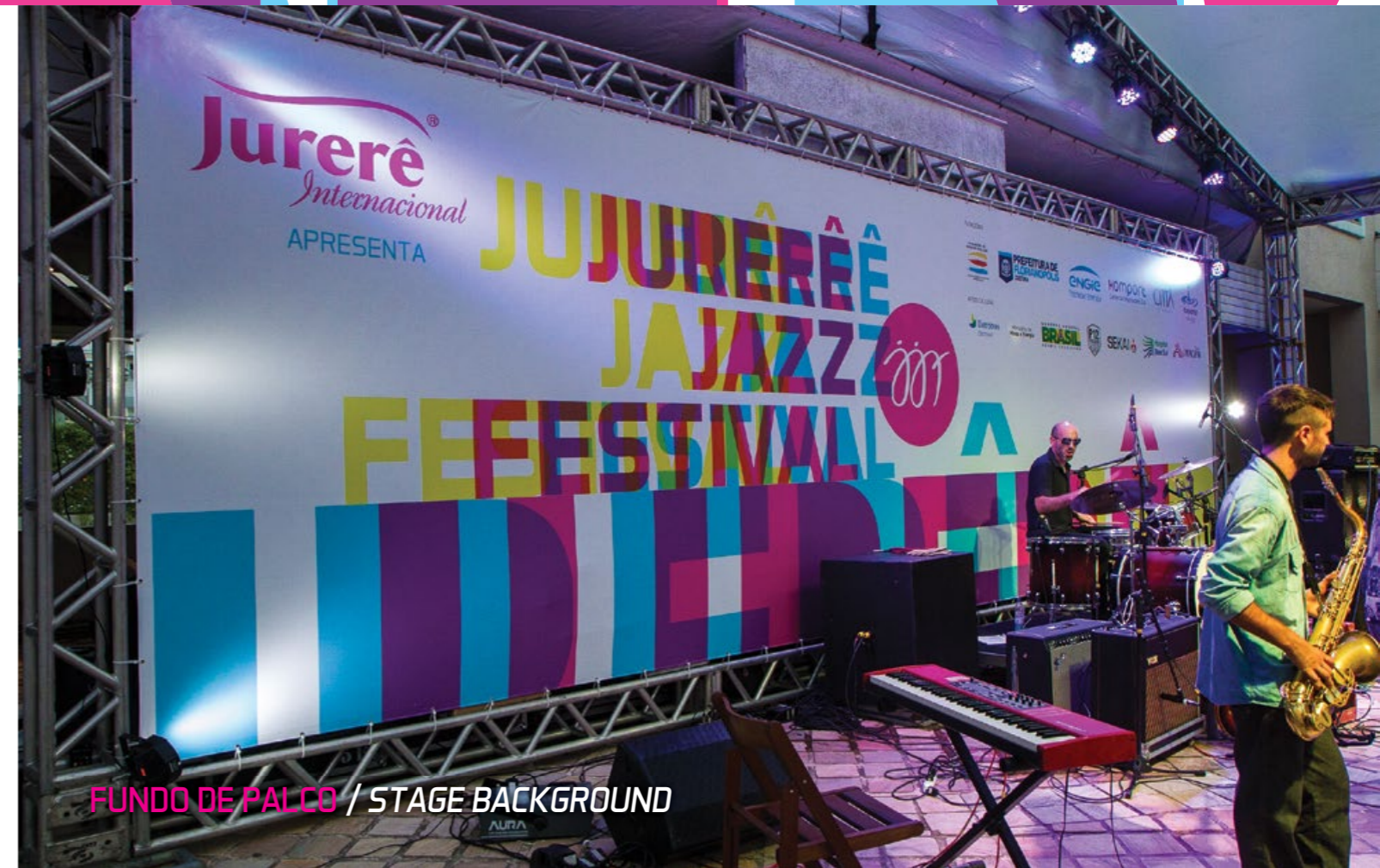
FUNDO DE PALCO / STAGE BACKGROUND